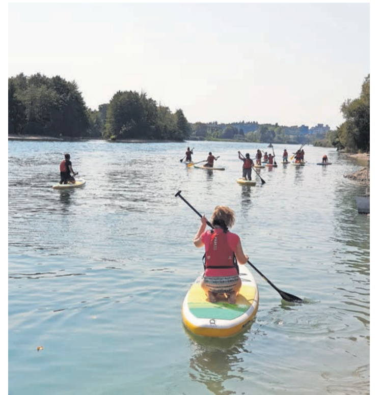
12 Teilnehmer meldeten sich für den Stand-Up-Paddling-Kurs an. Organisiert wurde er vom Familienclub Aarburg.

Fotos und Informationen unter www.familienclub-aarburg.ch