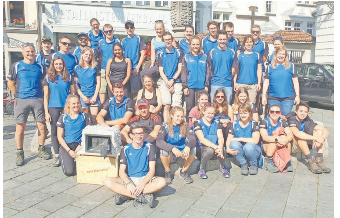
35 Turnerinnen und Turner nahmen an der Turnfahrt des STV Küngoldingen teil.

Geturnt wird dienstags von 20.15 bis 22 Uhr, mittwochs von 20 bis 22 Uhr und freitags von 20.15 bis 22 Uhr. Neue Mitglieder sind jederzeit willkommen.