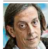
von Pedro Lenz

haben, hat manch ewigen Nörgler und Zweifler bereits zu pessimistischen Kommentaren verleitet. Schon vergessen